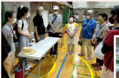
井荻小学校 体育館での カットフルーツ売り場!