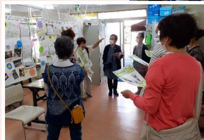
留学生による キャンパスツアー(東京女子大学)