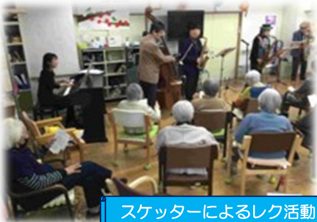
スケッターによるレク活動