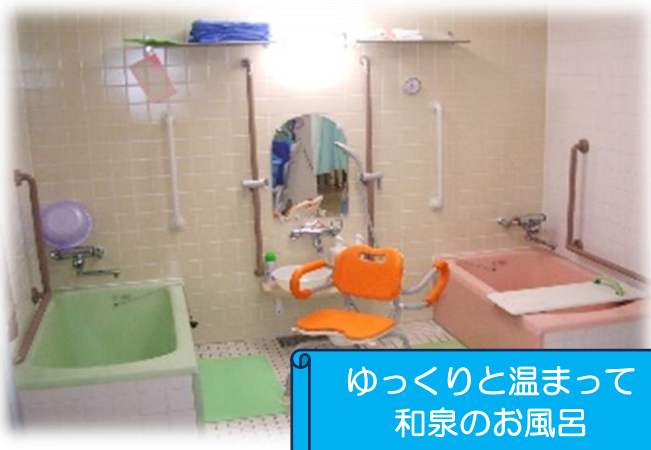
ゆっくりと温まって 和泉のお風呂