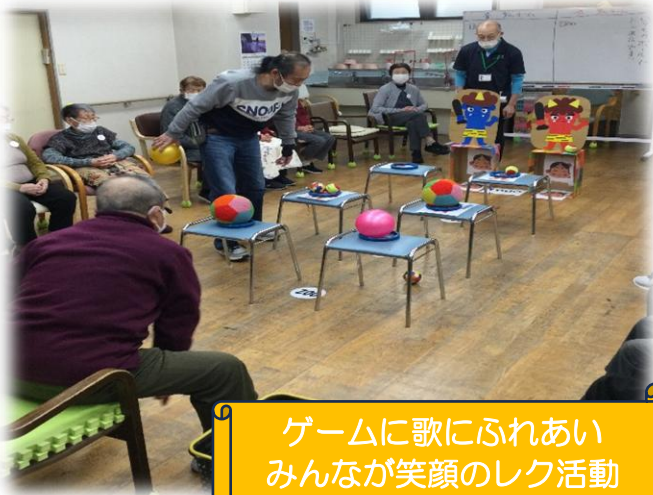
ゲームに歌にふれあい みんなが笑顔のレク活動