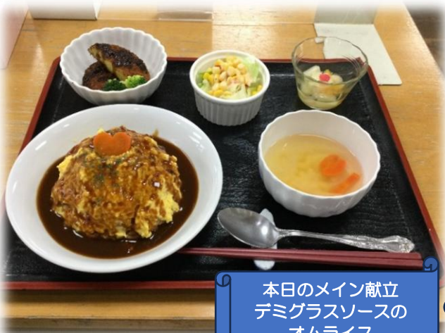
本日のメイン献立 デミグラスソースの オムライス