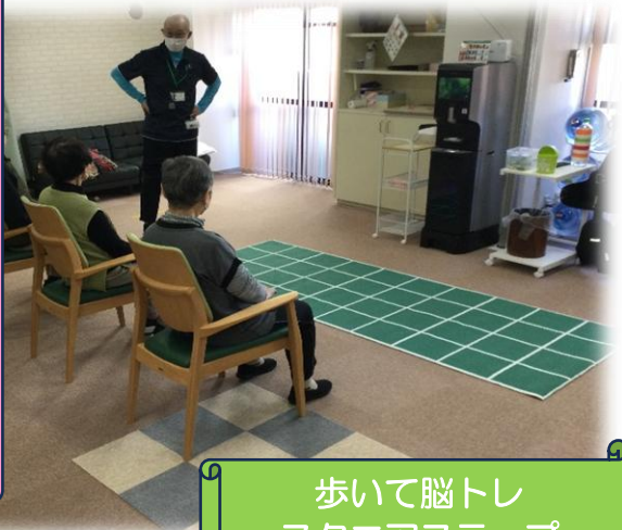
歩いて脳トレ スクエアステップ