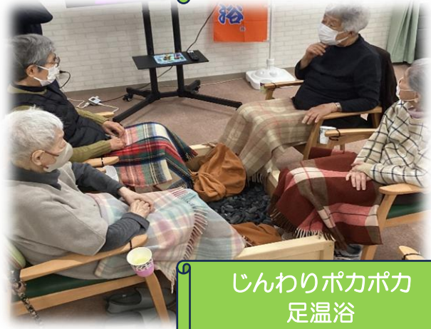
じんわりポカポカ 足温浴