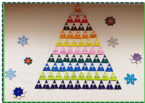
「こびとサンタのピラミッド」