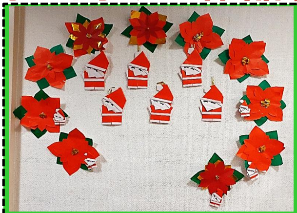
「ポインセチアとサンタクロース」