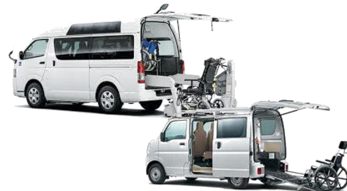
大型車両×1・小型車両×2で送迎に伺います