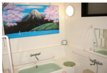
入浴（個浴×1、リフト浴×1）