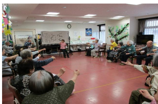
機能訓練体操・・・「エイ！」と元気に発声します