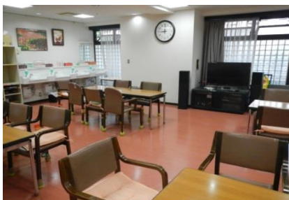
明るく広いダイニングルーム