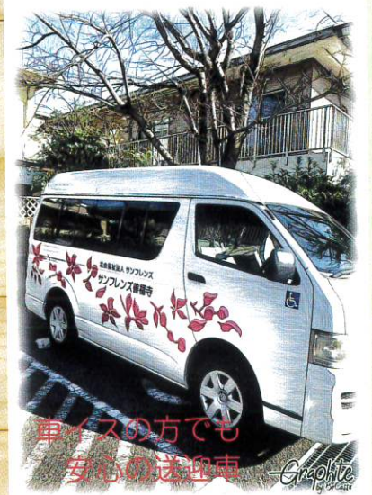
車いすの方でも 互心の送迎車