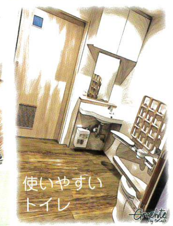
使いやすい トイレ