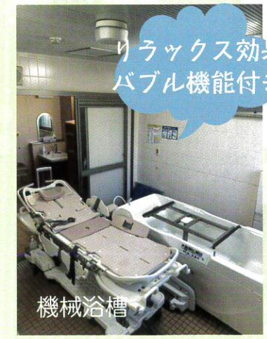
リラックス効果 バブル機能付き